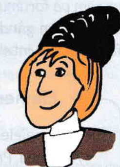
Păcală avocat, din volumul De-ale lui Păcală. Snoave populare

Judecătorul, auzind asta, a achitat procesul.